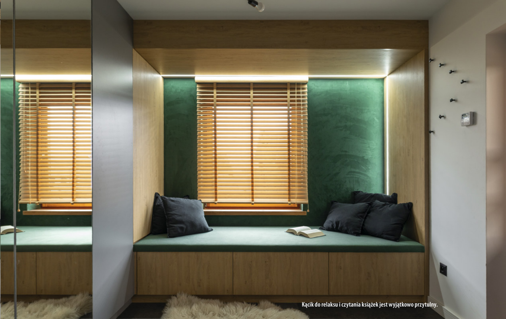
Kącik do relaksu i czytania książek jest wyjątkowo przytulny.