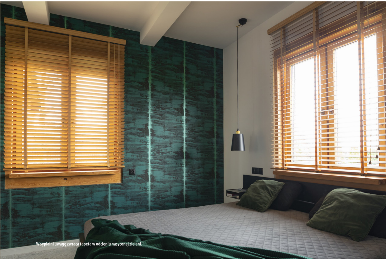
W sypialni uwagę zwraca tapeta w odcieniu nasyconej zieleni.