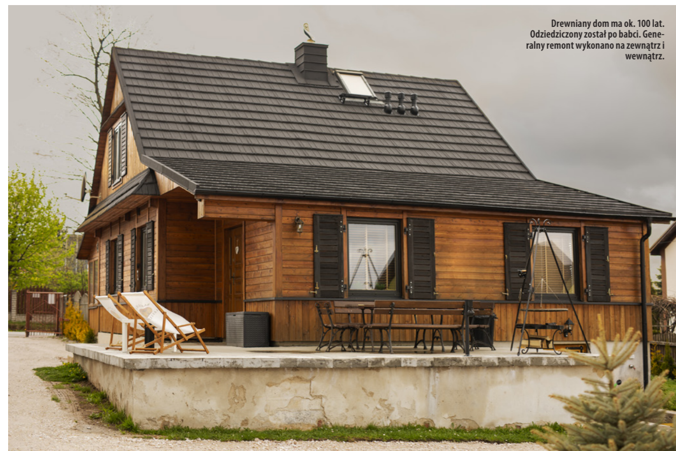
Drewniany dom ma ok. 100 lat. Odziedziczony został po babci. Generalny remont wykonano na zewnątrz i wewnątrz.