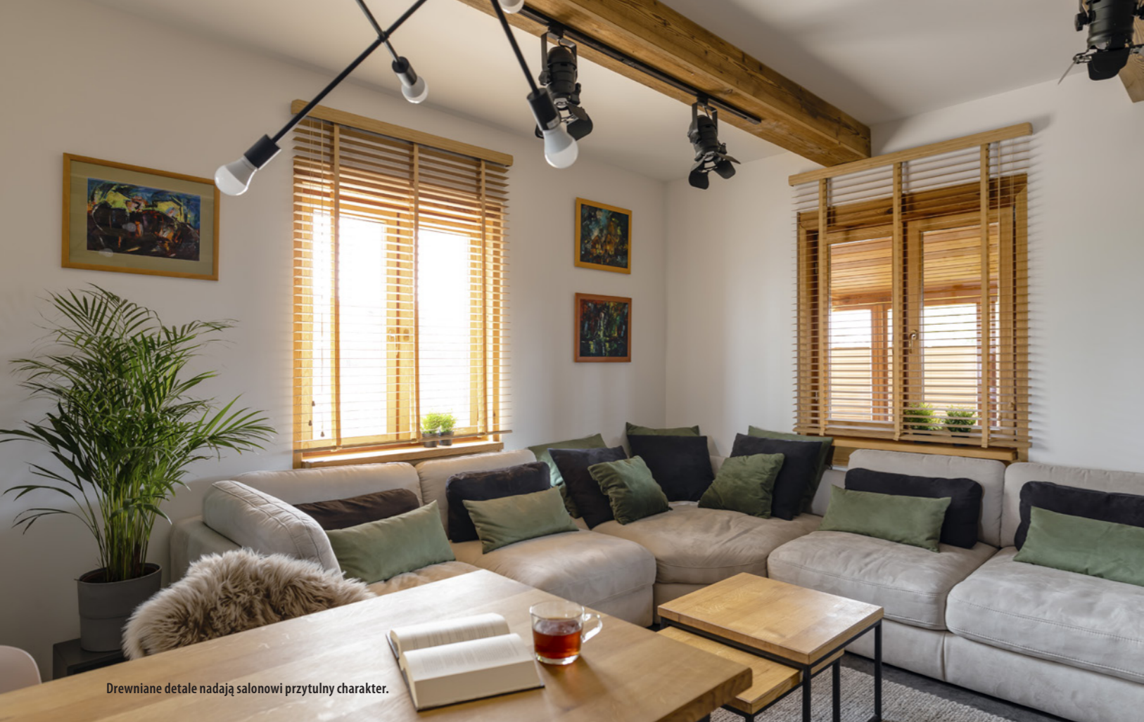
Drewniane detale nadają salonowi przytulny charakter.