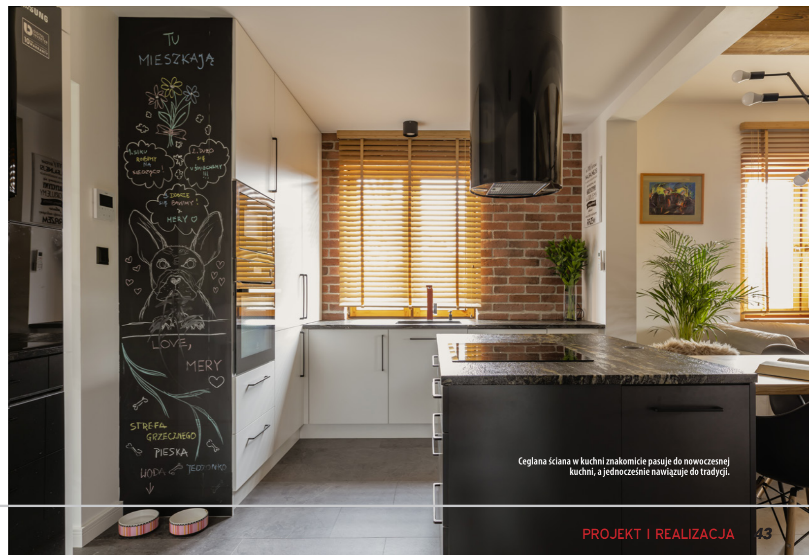
Ceglana ściana w kuchni znakomicie pasuje do nowoczesnej kuchni, a jednocześnie nawiązuje do tradycji.