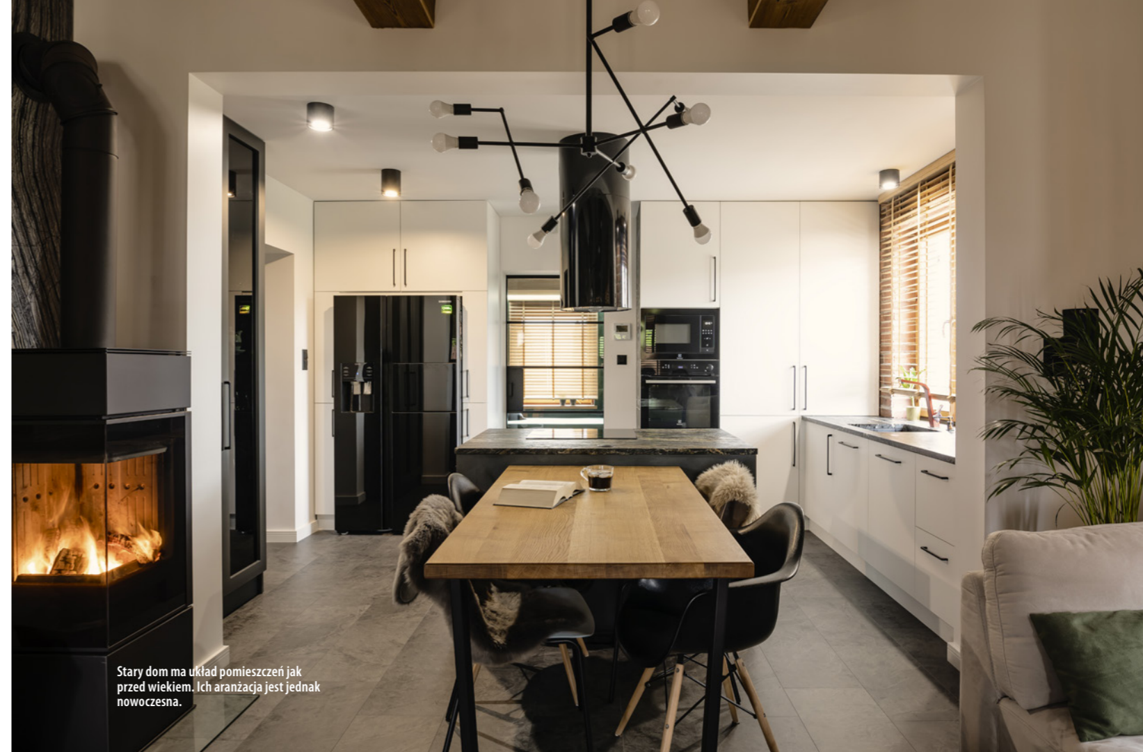
Stary dom ma układ pomieszczeń jak przed wiekiem. Ich aranżacja jest jednak nowoczesna.

Właściciele odnowili także wiekowy dom z zewnątrz. Budynek ogacono, czyli oszalowano deskami. Okna otrzymały stylowe, drewniane okiennice. Nowe pokrycie dachu do złudzenia naśladuje gont z drewna. Obok domu wygospodarowano miejsce na duży taras. Jest bliżej natury i rodzinnie – jak dawniej. ▶