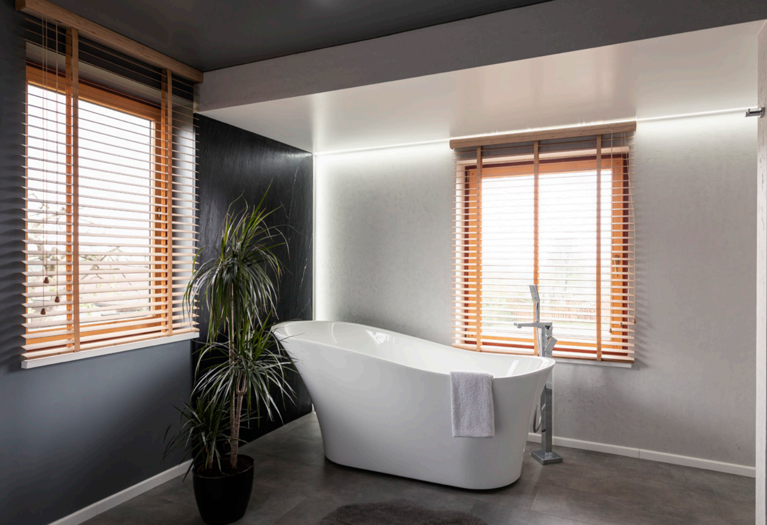
Łazienka to komfortowy salon kąpielowy. Są tutaj m.in. piękna wanna i dwie umywalki.