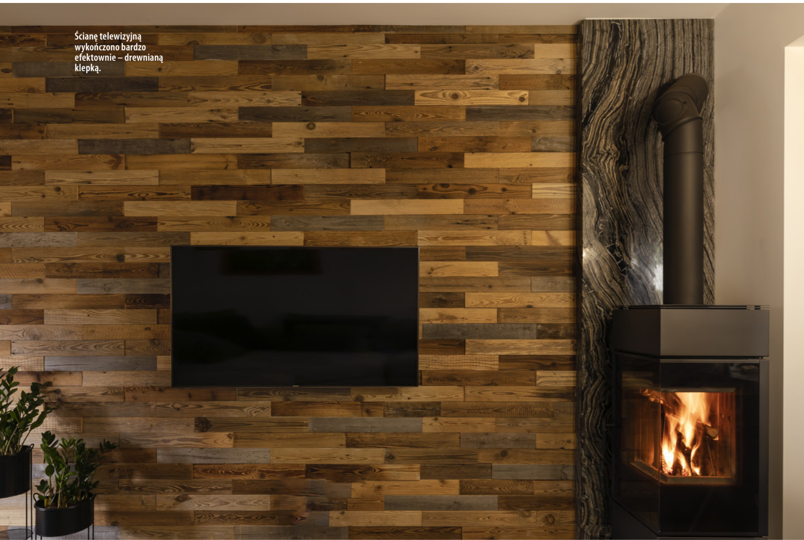
Ścianę telewizyjną wykończono bardzo efektownie – drewnianą klepką.