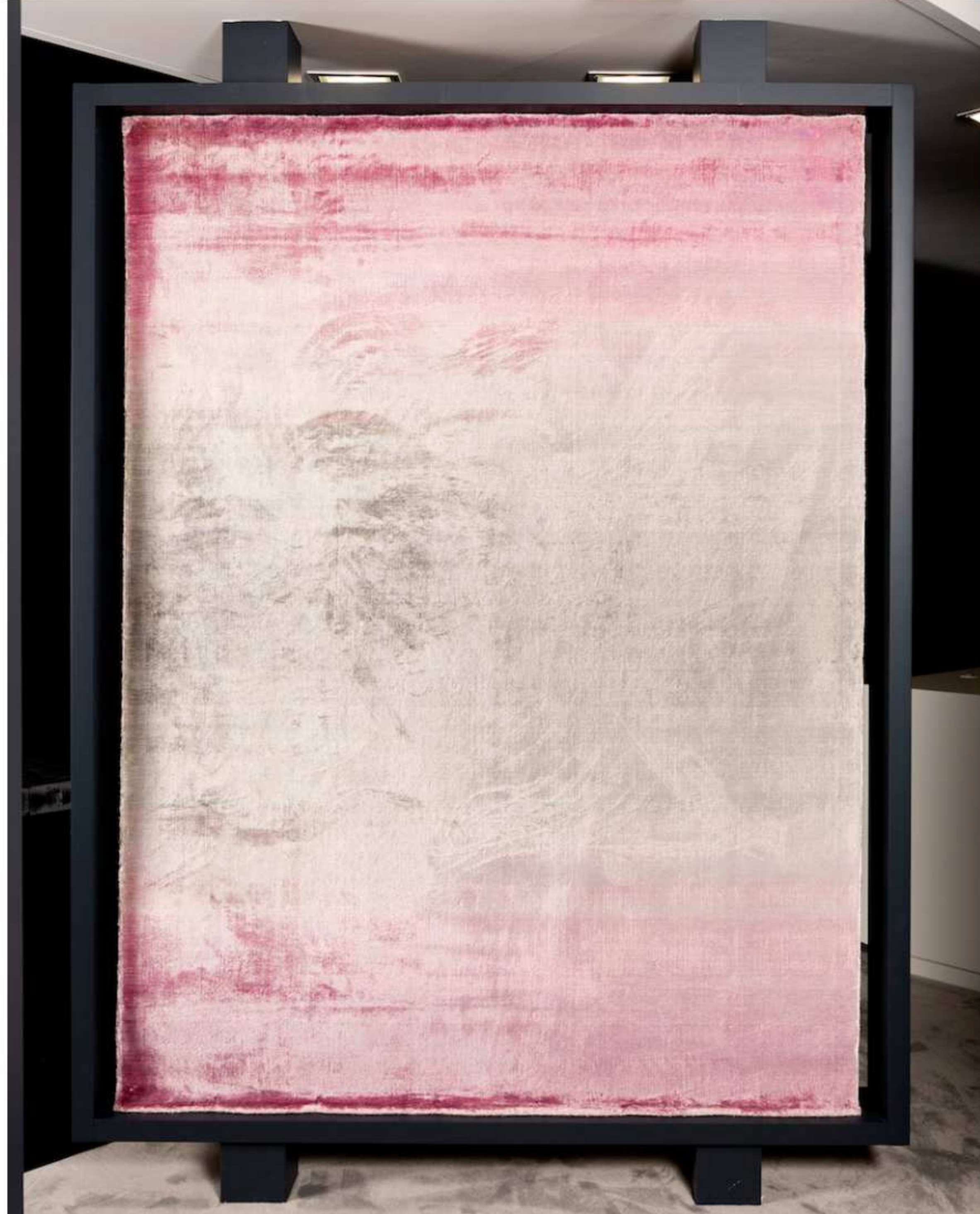
Fot. Epic Carpets / Aurora .

Kolekcję New Life można określić mianem antycznych patchworków. Projektanci marki wpadli na pomysł ratowania starych, zabytkowych dywanów, poddawania ich konserwacji, a następnie szycia z ich kawałków zupełnie nowych wzorów. Ten artystyczny recykling zaowocował nieszlachetnymi motywami, które mają charakter wiekowych pamiątek przekazywanych w rodzinie z pokolenia na pokolenie.